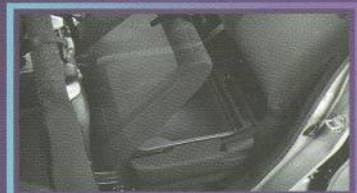
NEW! Black Under Seat Tray

Kompartemen rahasia untuk menyimpan barang berharga