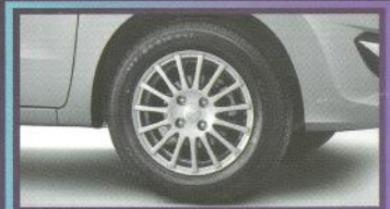
Velg 14" Alloy Wheel

Menambah stabilitas berkendara di segala situasi