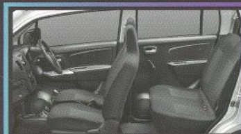
NEW! Black Fabric Seat

Menambah stabilitas berkendara di segala situasi