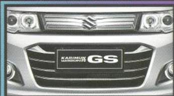
NEW! Front Grille

Desain impresif menambah penampilan lebih stylish