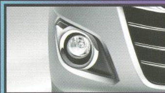
NEW! Fog Lamp