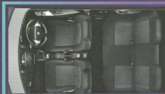
Spacious & Luxurious Cabin

Desain panel modern stylish dan penuh gaya