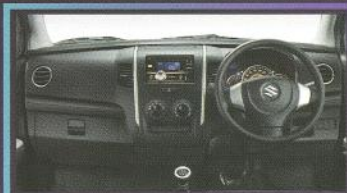
NEW! Black Dashboard

Interior lebih mewah dalam balutan warna hitam